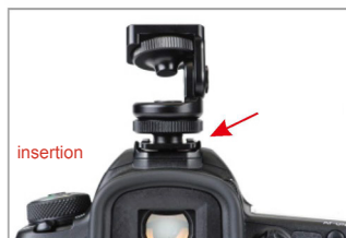
(fig. 1) (fig.2)